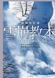
「増補改訂版雪崩教本」 (2022、山と溪谷社)